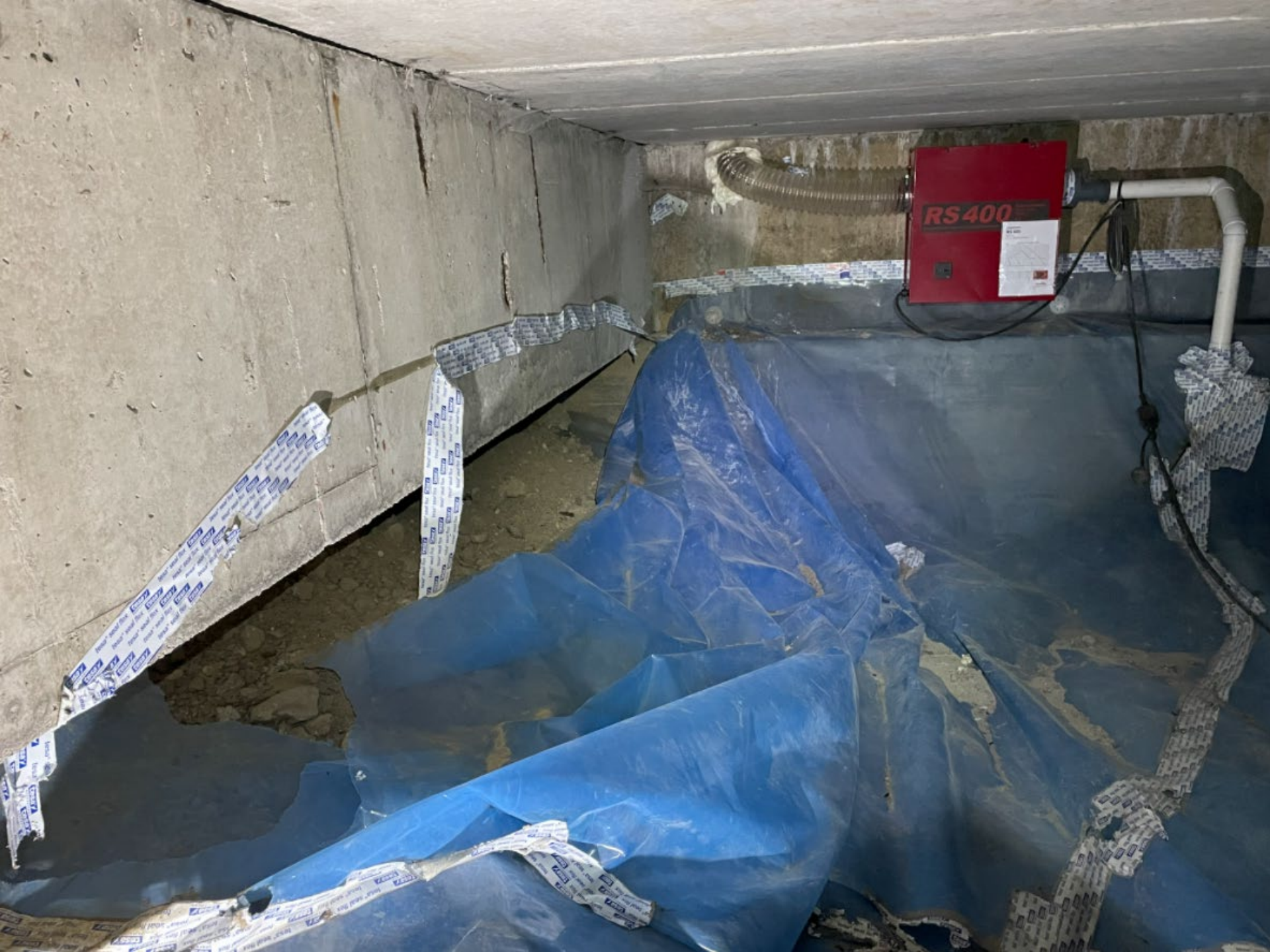
Exempel på åverkan Längst bort vid gaveln under 54:an.