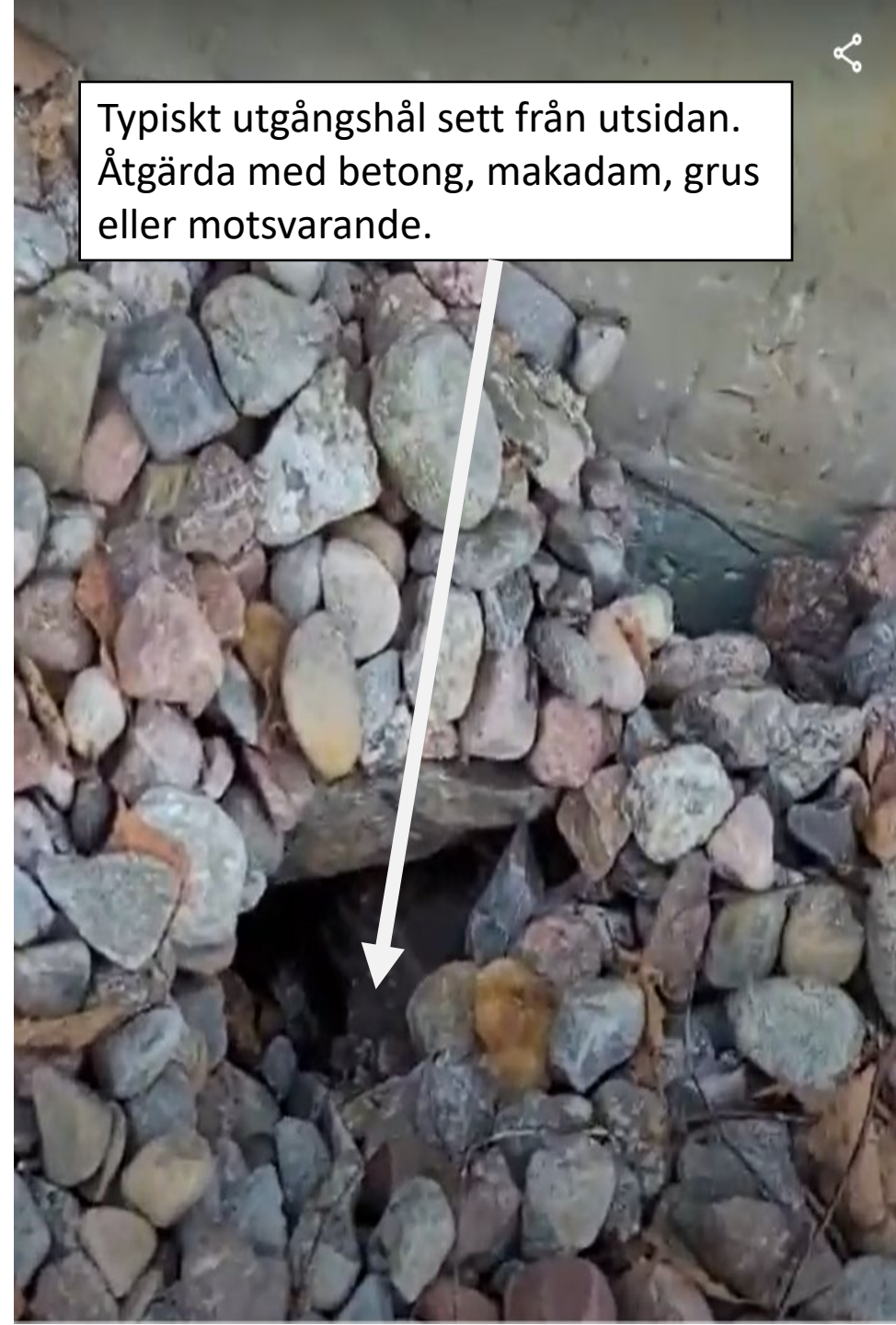
Typiskt utgångshål sett från utsidan. Åtgärda med betong, makadam, grus eller motsvarande.