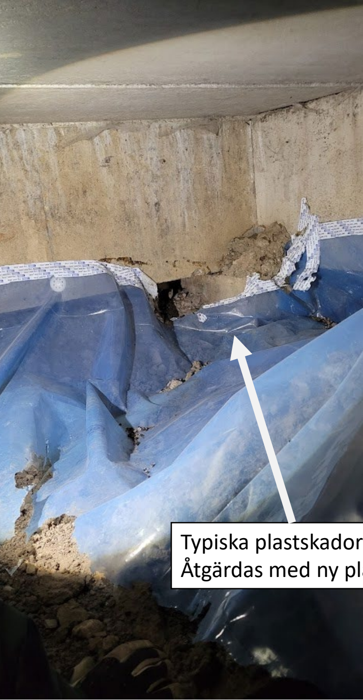
Typiska plastskador där råttor gnagt sönder. Åtgärdas med ny plast/tejp.